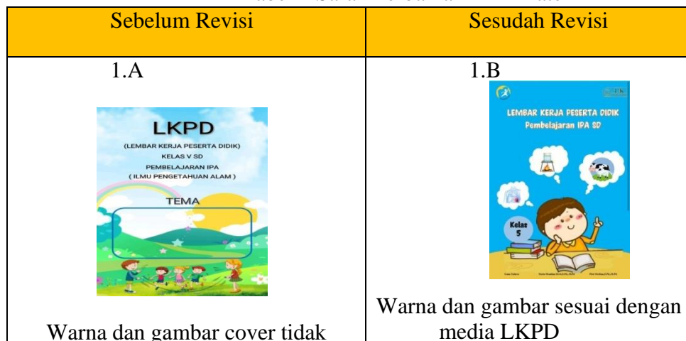
Tabel 2 Saran Perbaikan Ahli Materi

Catatan saran dari validator Tim Ahli materi baik secara tertulis maupun lisan secara umum tercantum pada Tabel 2 sebagai berikut :