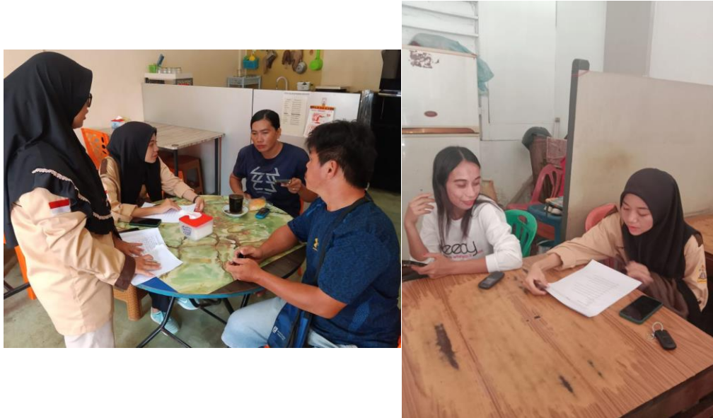
Gambar 6. Wawancara Masyarakat

saat acara besar . banyak sekali remaja disekitar wilayah meral mabuk-mabukan ,selain itu Pendidikan yang rendah karena banyak sekali orang cina di Meral pendidikan nya hanya sampai disekolah dasar dan ada juga sama sekali yang tidak bersekolah.