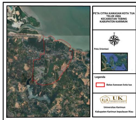
Gambar 3. Peta Citra Kawasan Kota Tua Tebing.

Lalu ada kota tua yang berada di meral kota. Daerah ini pun juga didominasi oleh toko-toko, warung makan, kedai kopi dan perdagangan lainnya. Meral kota ini pun menjadi pusat pemerintahan kecamatan meral. Karena letak wilayah yang dekat dengan pantai atau laut membuat pinggir dari meral kota ini banyak menggunakan rumah panggung agar saat air laut pasang tidak menenggelamkan rumah rumah yang ada di pinggir. Meral Kota juga dinamai salah satu pemukiman pesisir Di Minapolitan, Kabupaten Karimun dan seperti pemukiman pesisir pada umumnya, di kawasan itu memainkan peran penting dalam kegiatan ekonomi.