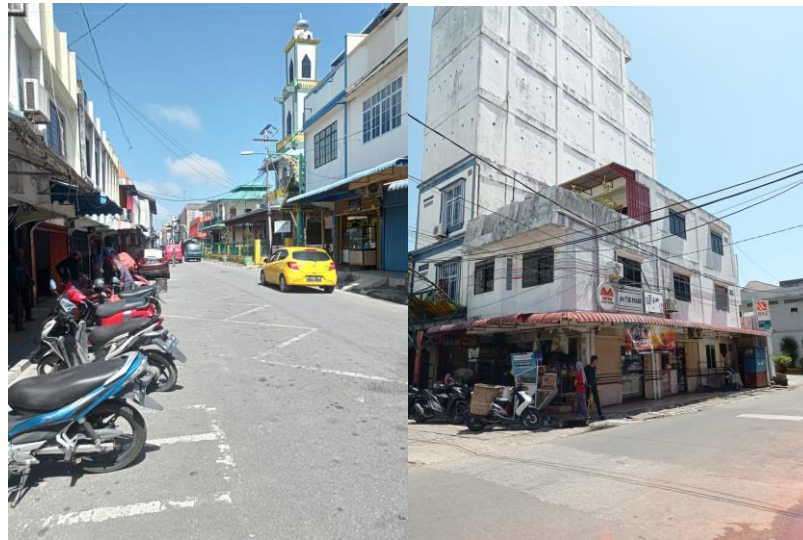
Gambar 4. Jalur Transportasi Darat dan Kabel Listrik

Pemasangan kabel-kabel listrik di kawasan Kota Tua Tanjung Balai, tidak tertata rapi. Tinggi kabel-kabel tersebut hanya berkisar 4-5 meter, ditambah banyak penumpukan kabel pada satu tiang listrik meningkatkan risiko bahaya kebakaran dan merusak estetika kota.