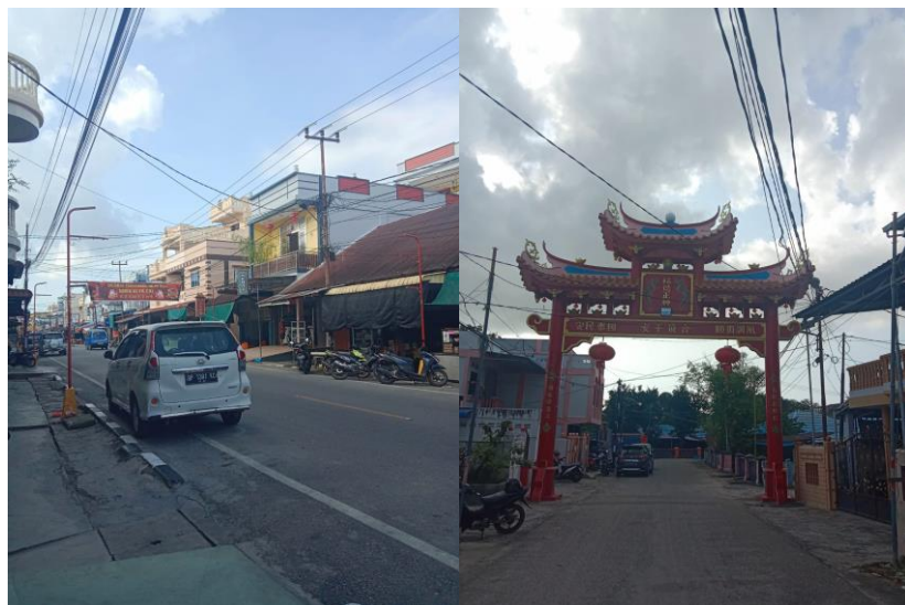
Gambar 5. Jalur Transportasi dan Kabel Listrik

memarkirkan kendaraan mereka di jalan raya. Lebar jalan yang sempit dan lahan parkir yang terbatas menyebabkan sering terjadinya kemacetan di Meral pada jam-jam produktif. Permasalahan di atas menjadi permasalahan yang vital di karenakan ruang gerak perencanaan yang terbatas dan bangunan yang telah terbangun, bangunan tersebut menjadi milik warga di Meral dan menjadi tempat tinggal sekaligus tempat usaha. Masalah kedua yang di hadapi di kota tua meral ada pada estetika ruang pada pemasangan kabel listrik. Pemasangan banyak di lakukan dengan menitik berat kan pada satu tiang dan mengganggu bangunan yang sudah bagus contoh nya pada gapura